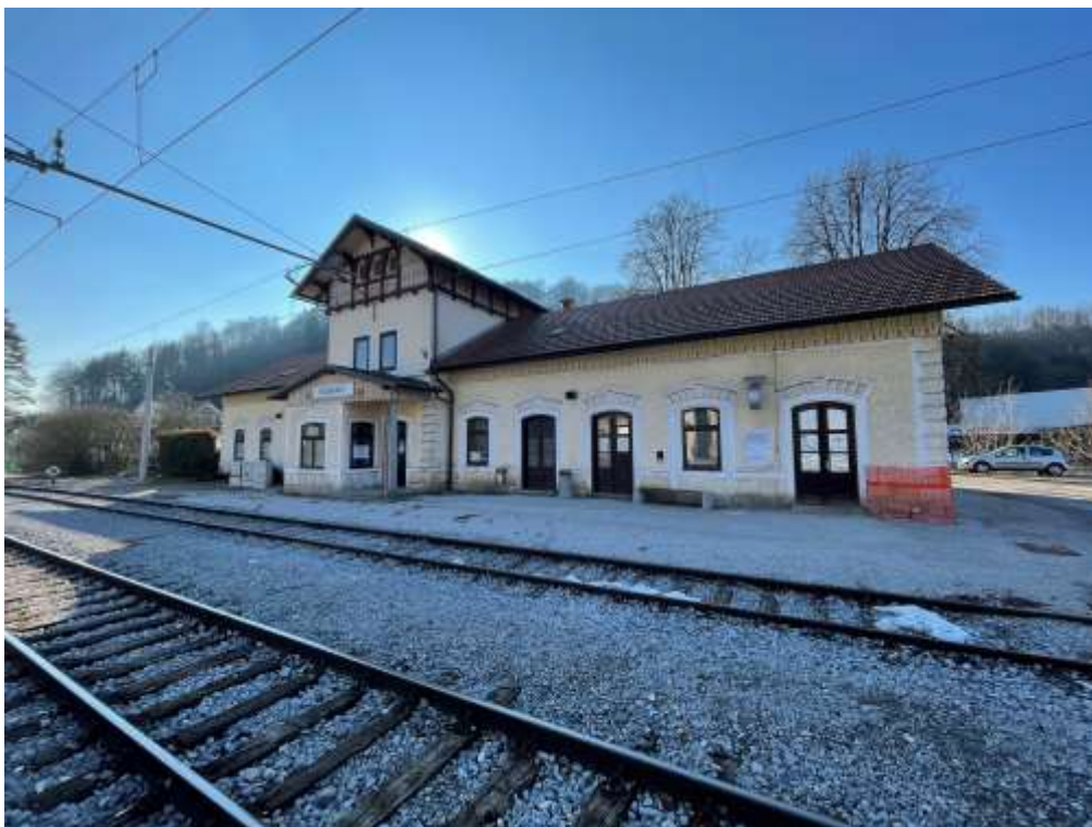
Slika 1: Železniška postaja Podnart