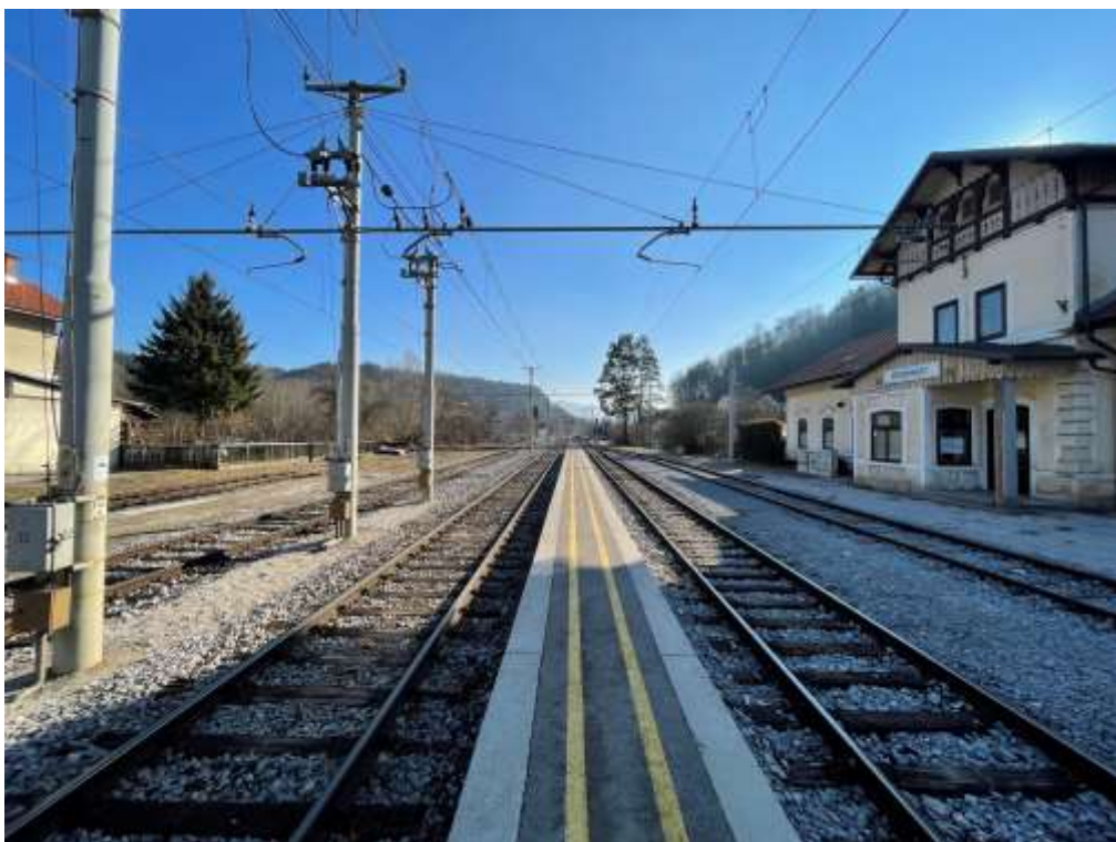
Slika 3: Peron v smeri proti Kranju