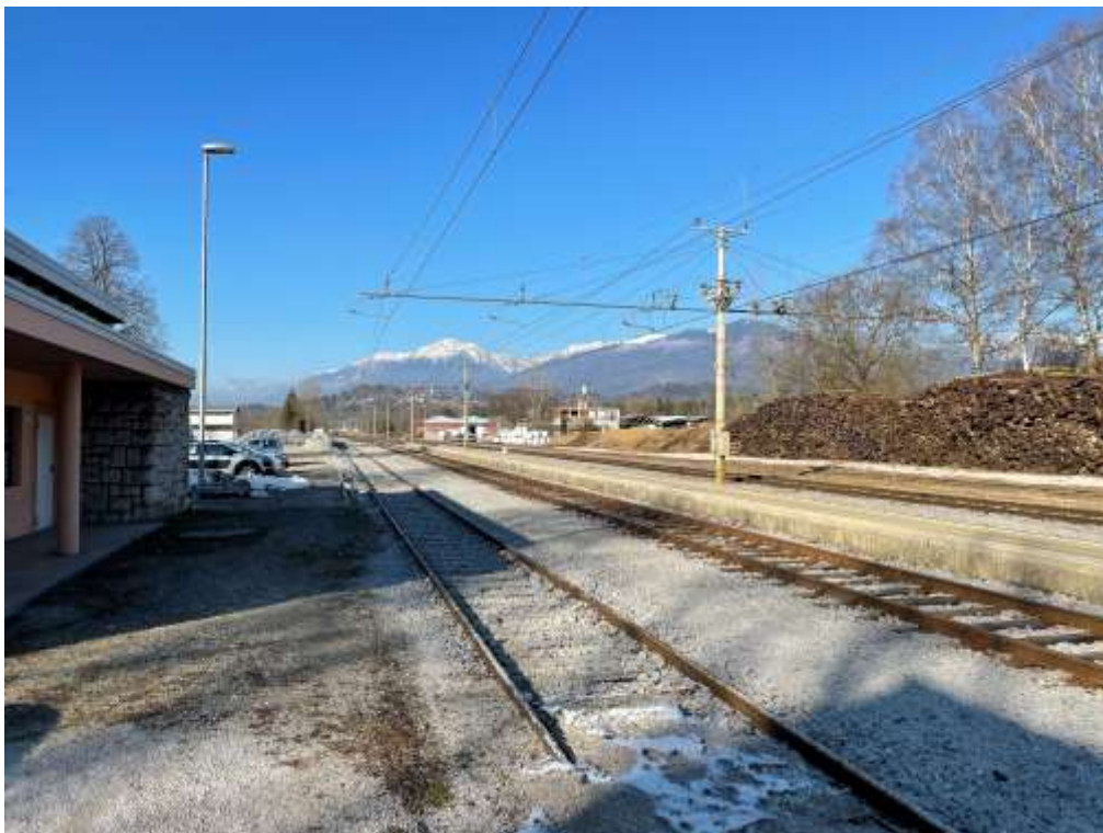
Slika 5: Tiri št. 001 – 005