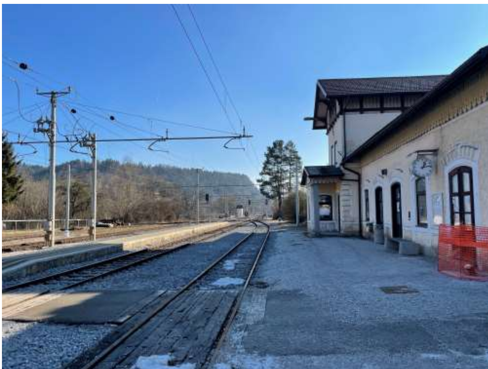
Slika 2: Prostor pred postajnim poslopjem